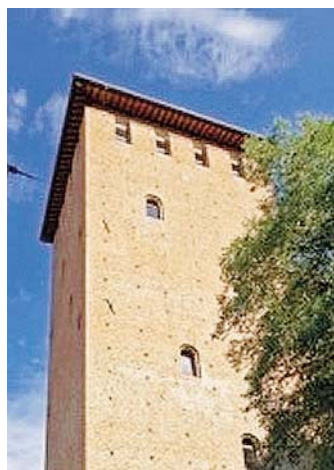
SOPRA LA SALA La rocca